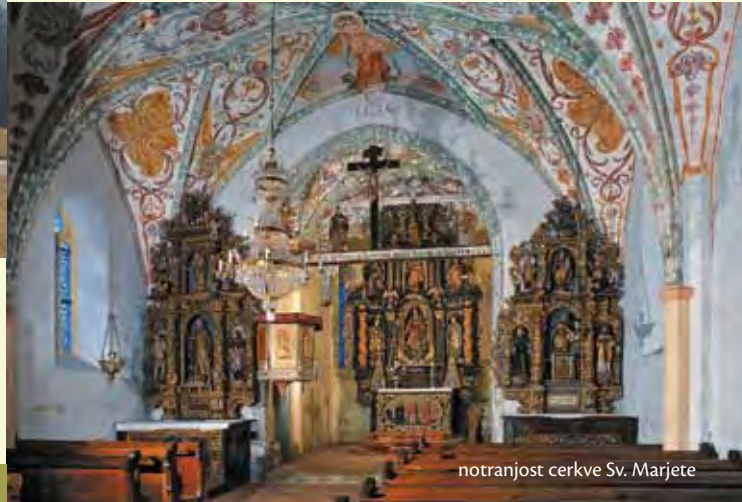
notranjost cerkve Sv. Marjete

Gotska okna so razdeljena s podboji v dva dela. Po vsej dolžini cerkve je opaziti stebre, ki se zaključujejo v sklepnike. Nad glavnim oltarjem sta podobi sv. Marije in sv. Marjete. Do leta 1631 je imela cerkev pet oltarjev. Posvečeni so bili sv. Marjeti, sv. Sebastijanu in sv. Antonu Puščavniku, sv. Lenartu, in Sveti Trojici. V letu 1631 so peti oltar, ki je stal pred cerkvijo, odstranili. Njegovi sledovi so vidni še danes.