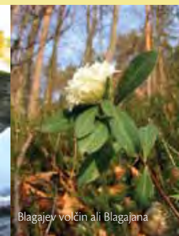
Blagajev volčin ali Blagajana