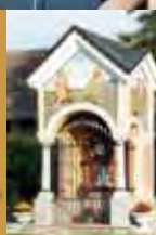
Kapela Sv. Jakoba