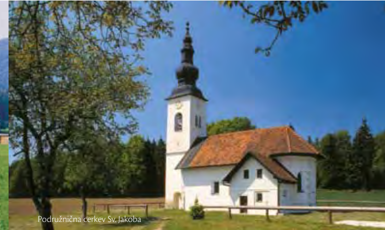
Podružnična cerkev Sv. Jakoba

Hraše so gručasta vas na južnem delu Gorenjske na nadmorski višini okrog 350 metrov. Leži na severo-vzhodni meji občine Medvode. Skozi vas pelje regionalna cesta Škofja Loka - Vodice - Kamnik.